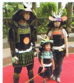
手づくり甲冑試着体験