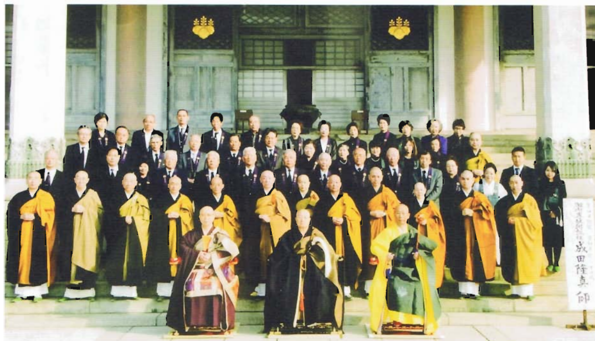
曹洞宗大本山總持寺 報恩大授戒会 焼香師記念 平成26年4月13日 龍谷寺本山参拝団