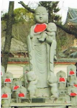
水子観音様は龍谷寺の境内南側の道路に面した所にお祀りしており、いつでもご自由に参拝できます。

年に一度の水子様の供養を行います。心の中に薄縁の水子様のが気になる方、さまざまなきご供養を供養できずにいる方、ぜひこの機会に供養をおすすめていただきます。