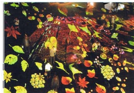
光の切り絵、野外幻灯